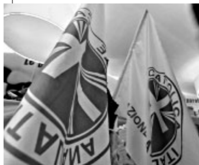
Genova ricorda la storia dell'associazione. Milano: «Guardiamo alla storia per pensare il futuro»

GENOVA. L'Azione cattolica «è una presenza assolutamente feconda per la Chiesa, per la comunità cristiana e per l'intero Paese». L'associazione deve quindi rispondere alla sfida primaria della società contemporanea, ossia l'individualismo, che è figlio «di una mentalità secolarista» e che si ripercuote anche sul «piano relazionale». Ad affermarlo è stato l'arcivescovo di Genova e presidente della Cei, il cardinale Angelo Bagnasco, in occasione del convegno «L'Azione cattolica oggi: sfida educativa ed impegno nella società», organizzato per i 140 anni dell'Ac a Genova, che si è svolto ieri sera presso Palazzo San Giorgio, sede dell'Autorità portuale. Le sfide alla società e alla Chiesa, ha affermato il porporato, «derivano da una