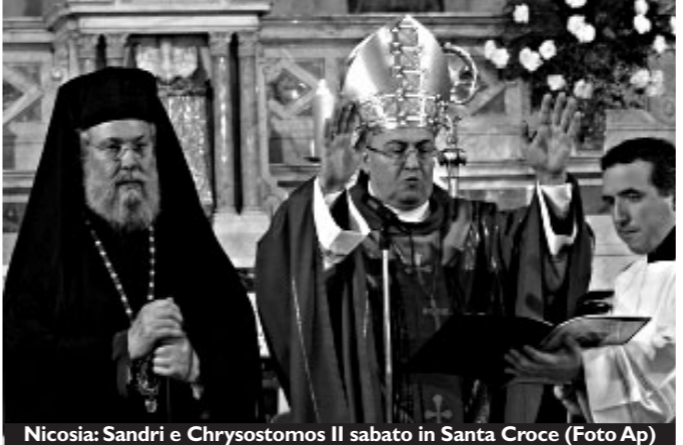
Nicosia: Sandri e Chrysostomos II sabato in Santa Croce